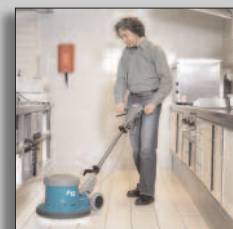
Maschine im Einsatz