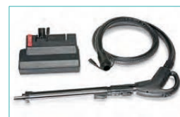
Sonderzubehör Elektrokrit: Elektrosaugbürste 30 cm, 100 W Elektro-Teleskoprohr Elektro-Saugschlauch