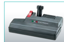
Elektrosaugbürste 36 cm, 200 W