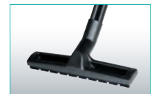
Hartbodendüse mit weichen Borsten