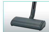
Elektrosaugbürste 28 cm, 30 W

Kessel-Trockensauger S 20 E Art.-Nr. 36 20 003