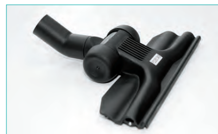
Bodengelenkdüse „Welle 28“ Passend für alle Trockensauger Art.-Nr. 32 00 840