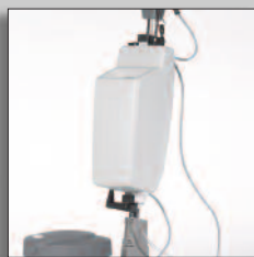
Flüssigkeitstank (14 L)