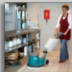
Maschine im Einsatz